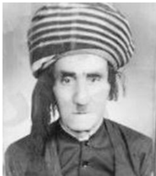
حەمەشەریف بەگی ئالمانه

کورتە ناساندنیکی ئەو کەسایەتیانە لە نامە کەدا ناویان هاتوو: