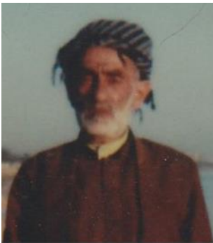
حه‌مه‌ره‌شید به‌گی ئالمانه