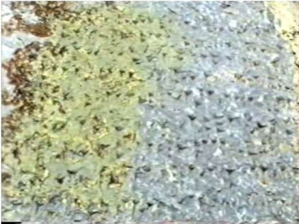
Figure 2. The largest photograph from the video.

وینہی ژماره ۲، گه‌وره‌ترین وینہی هه‌لگیراو له‌به‌ر قیدیوکه