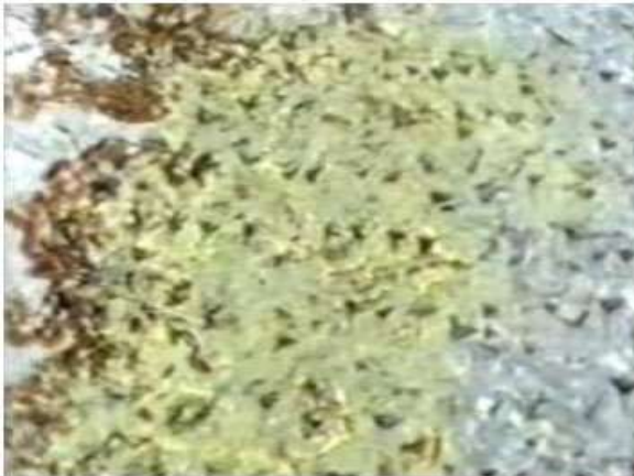
Figure 3. Left and central section of lines 1-8.

وینہی ژماره ۲، گه‌وره‌ترین وینہی هه‌لگیراو له‌به‌ر قیدیوکه