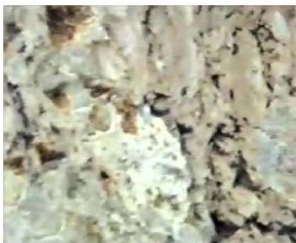
Figure 7. End of lines 1-2.

وینہی ژماره ۵، دسته چپ، سهره‌تای دیری ۱ تا ۵. وینہی ژماره ۶، دسته راست، بهره و کوتایی دیری ۱ تا ۳.