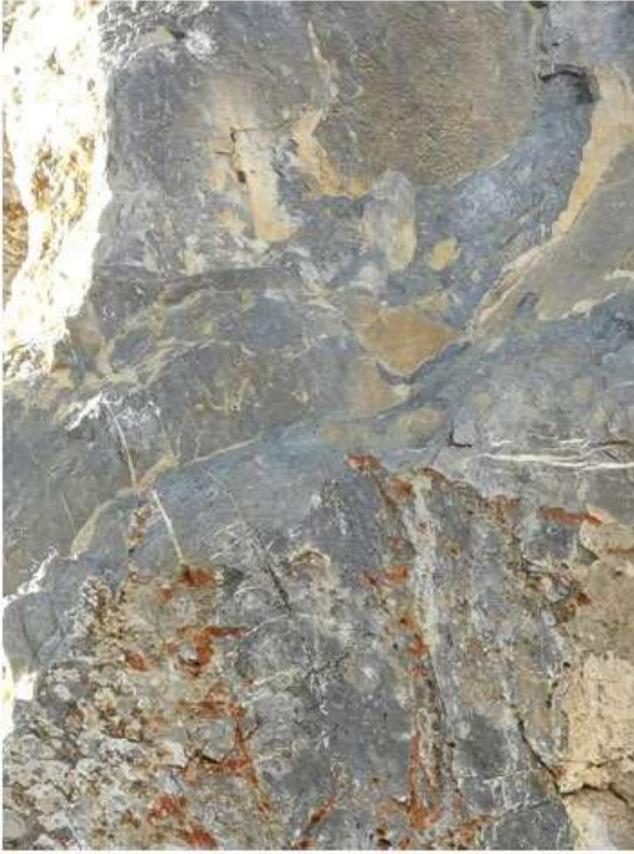
Figure 19. Detail of the gap in the rock.