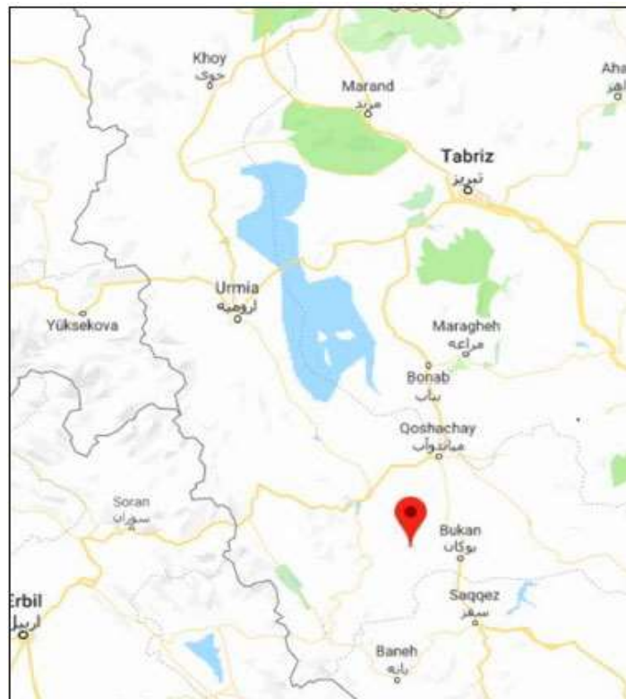
وېنەھى ژمارە ۱، شوئىنايەتى بەردنووسە كەھى تەرەغە

ھەموو ئەو وېننەھى وا لە كۆتايى دەقە ئىنگليزىيە كەدا ھاتوون، لە لاپەرەكانى خوارەوھى وەرگىراوھ كوردىيە كەدا دەبىنرئىن: