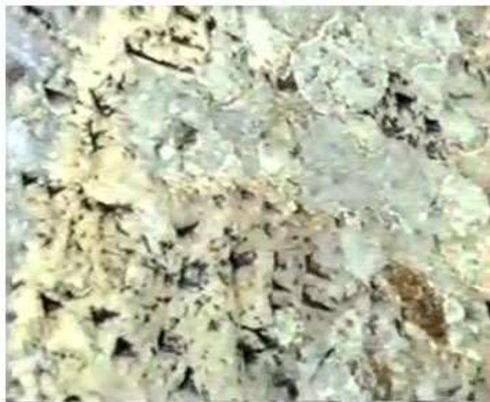
Figures 11-12, 14. Lines 4-7.