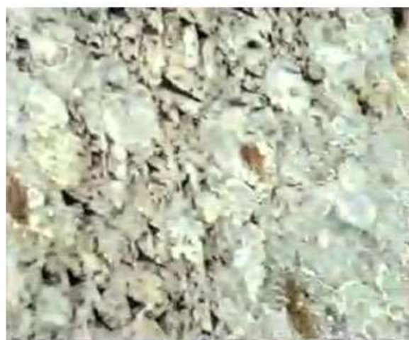
Figure 15. Line 3 towards the end.

وینہی ژماره ۱۲، دهسته چپ، دیری ۷ تا ۹. وینہی ژماره ۱۵، دهسته راست، دیری ۳ بهرہ و کوتاییه کھی.