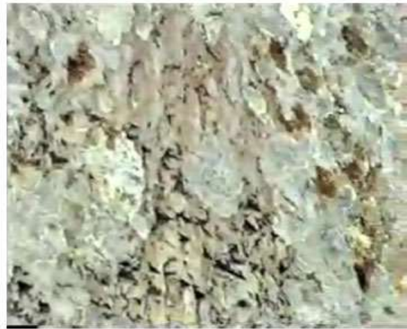
Figures 8-10. Lines 1-3.

وینہی ژماره ۹، دهسته چپ، وینہی ژماره ۱۰، دهسته راست. [ههرسی وینہی] ژماره ۸ و ۹ و ۱۰ دیری ۱ تا ۳ [ی بهردنوسه که پیشاندهدهن].