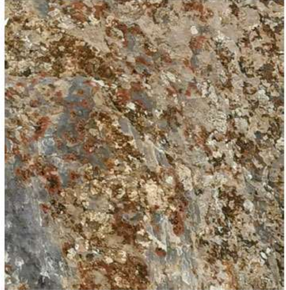
Figure 20. Rock and lichens below the break.

وېنەى ژماره ۱۹، دهسته چهپ، چۈنیه تی بۇشاییه که لهسهر تاشه بهرده که پېشان ددهات. وېنەى ژماره ۲۰، تاشه بهرده که و مه خمه لینه (گل سنگ) ی لای خواره وهی شوېنه تېکشکاوه که.