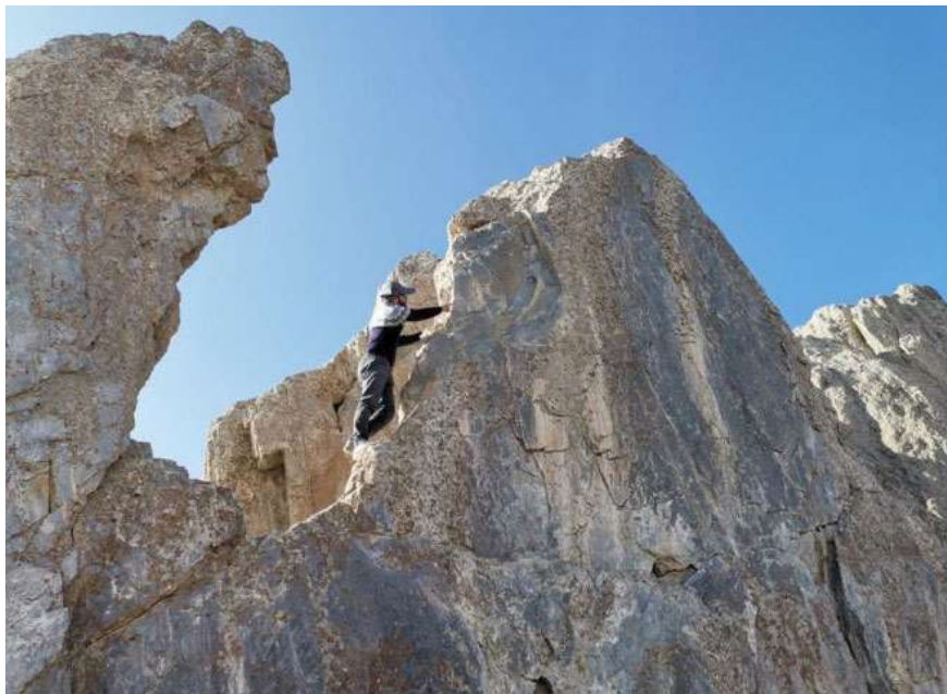
Figure 18. Almost at the summit of the mountain. The person is indicating the point where the inscription was situated.

وینہی ژماره ۱۸، نزیک ترۆپکی چیاکه. نه‌و که‌سه، نامازه به شوپنیک ده‌کات که به‌ردنوسه‌که له‌وت بووه.