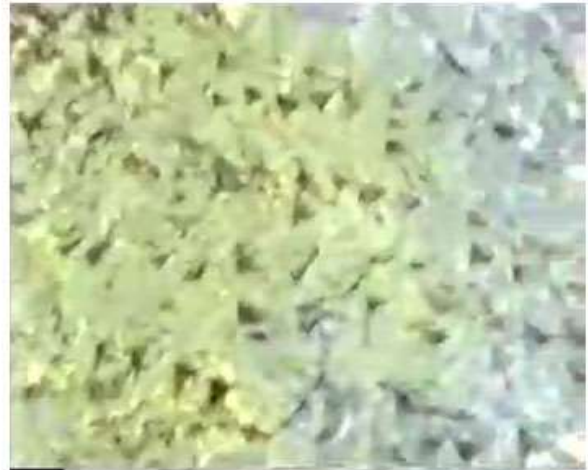
Figure 4. Beginning of lines 1-4.

وینہی ژماره ۳، ده‌سته‌چه‌پ، به‌شی لای چه‌پ و ناوه‌ندی دیری ۱ تا ۸. وینہی ژماره ۴، ده‌سته‌راست، سه‌ره‌تای دیری ۱ تا ۴.