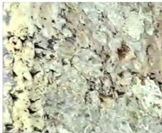
Figure 6. Towards the end of lines 1-3.

وینہی ژماره ۵، دسته چپ، سهره‌تای دیری ۱ تا ۵. وینہی ژماره ۶، دسته راست، بهره و کوتایی دیری ۱ تا ۳.