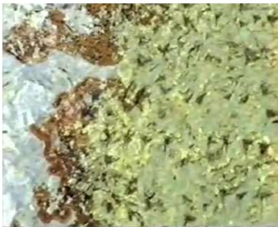
Figure 5. Beginning of lines 1-5.