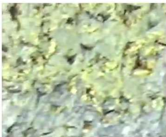
Figure 13. Lines 7-9.