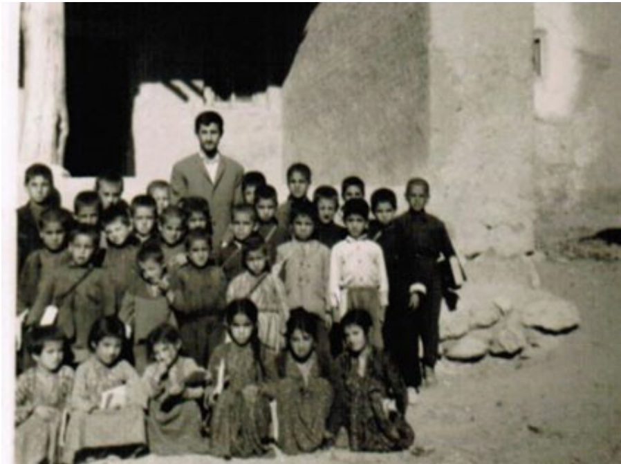
لەگەڵ قوتابیانی کچ و کوری پۆلی دووهمی قوتابخانەیی بوغدهکهندی، لە بەردەم چەقەخانەیی تاریک و تنۆکی مزگەوتی گوندەکە، که قوتابخانەیی مندالان و چەقەخانەیی هەرزەکاران هەردووکیان بوو! سالی خویندی ۱۳۴۳ - ۴۴.

ئەوێش دوو وینە لە قوتابیانی گوندی بوغدهکهندی و مەدرەسەیی سپەهداری ئەراک که جەناپم مامۆستایان بوو. شەرحیانم لە پەراویژدا نووسیوه. ئەوی خوارەوه، دەستەچەپیان هی بوغدهکهندییە و دەستەپاست هی ئەراک. سەیریکی پوڵەتی قوتابییه کوردەکان بکەن لە بەراورد لەگەڵ قوتابیانی ناوچەیی هەژارنشین ئەراک. ئەوێ باروودۆخی قوتابی کوردە، که لە چەقەخانەیی مزگەوت و بی کورسی و میز لەسەر حەسیری گرێچن دادەنیشان و پووناکایی قوتابخانەکەش، ئەگەر بتوانین پێی بلین «پووناکایی»، لە تاقە یەک پەنجەرەیی بچووکێ لای کەوشکەنەکەوه دابین دەبوو و لەلای ژوورەووتر، چاوی چاوی نەدەدیت.