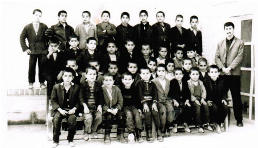
له‌گه‌ل قوتابییانی پۆلی دووه‌می قوتابخانه‌ی «سپهدار»ی ئه‌راک، رۆژی ۱۳۴۴/۱۲/۴.

دیاردە‌ی سه‌یروسه‌مه‌ره‌ی وا له‌ شاره‌کانی ئۆستانی ناوه‌ندی ئێران‌دا زۆر بوون که ئیمه له‌ کوردستان نه‌مانییوو. با ده‌سنیشانی یه‌ک‌دوو نمونه‌ بکه‌م بۆ ئه‌وه‌ی بلیم ئیمه له‌ کوردستان چه‌نده بی‌ئاگا بووین له‌ راسته‌قینه‌ی کۆمه‌لگا‌کانی دیکه‌ی ئێران و چون ئیرانمان ته‌نیا له‌ ده‌لاقه‌ی کتیب و راگه‌یانندی رۆژنامه و وتاری حیزبه‌کانه‌وه‌ ده‌ناسی. بۆ نمونه، نه‌مانده‌زانی هینزی ئایینی و برۆای خه‌لک به‌ ریبازی شیعه، ته‌نانه‌ت ماوه‌یه‌کی زۆر پیش دامه‌زرانی کۆماری ئیسلامیش، چه‌نده به‌هیز بوو و خومه‌ینی و مه‌لاکان و مامۆستا رۆژاوا‌یی‌یه‌کانیان چون له‌ سالی ۱۳۵۷دا سواری شه‌پۆلیک بوون که گه‌لیک پیشتر له‌ ئێران‌دا هه‌لیکردبوو و ئیمه نه‌مانده‌دیت. له‌ شاری «مه‌حه‌للات» و «خومه‌ین»ی په‌نای «قوم» تیغی ریش‌تاشین له‌ دوو‌کانان‌دا نه‌ده‌فرۆشرا و به‌ «مکروه» ده‌زانرا. ته‌بعیدییه‌کانی ئه‌و شارانه‌ ده‌بوو تیغ له‌ شاره‌کانی دیکه‌ بکرن؛ جا ده‌بن له‌ شاری قوم چ خه‌به‌ر بووبن!